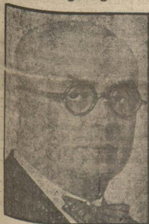
Başvekil Celâl Bayar

Parti Grupundaki müzakereler esnasında sabık Dahiliye Vekili Şükrü Kayamın dahi gördüğü lüzum üzerine beyanatta bulunduğu haber veriliyor