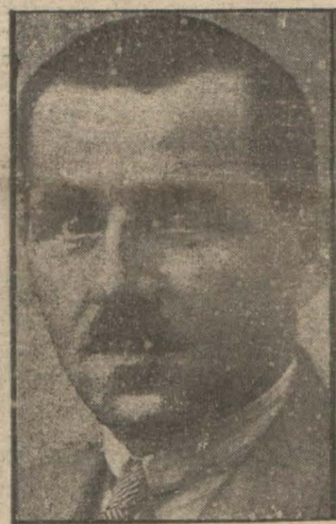
Hariciye Vekili Şükrü Saracoğlu