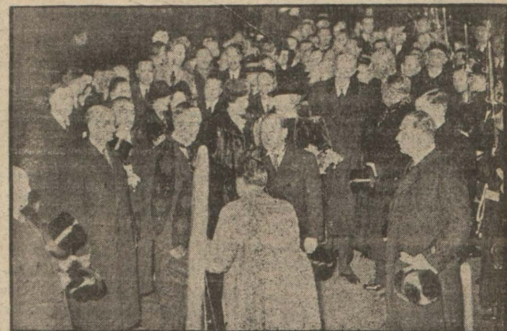
Çemberlayn ve Halifaksın son Pa ris seyahatlerine aid bir intiba (Yazısı 11 inci sayfada)